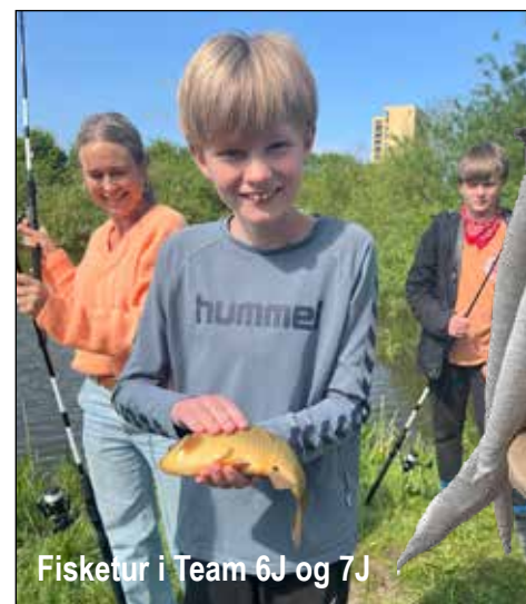
Fisketur i Team 6J og 7J