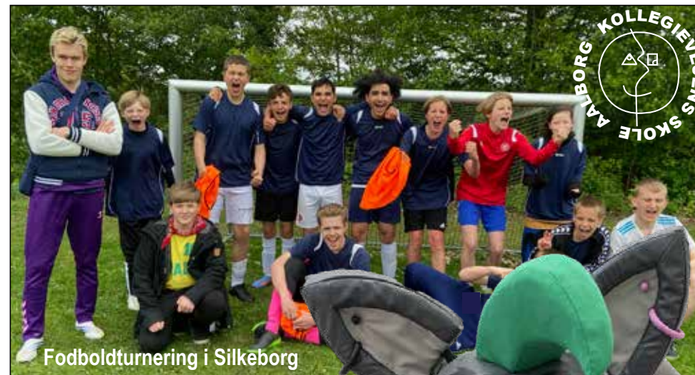
Fodboldturnering i Silkeborg