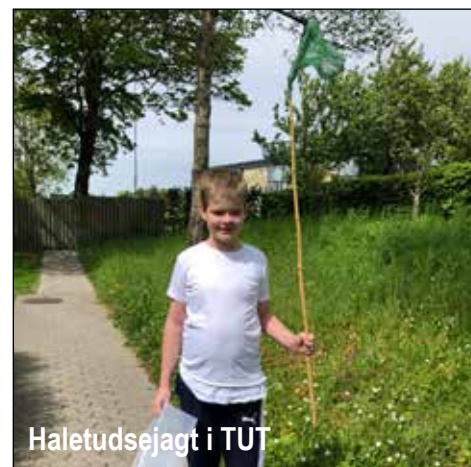
Haletudsejagt i TUT