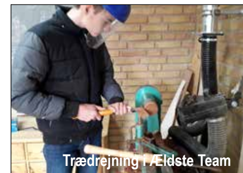
Trædrejning i Ældste Team