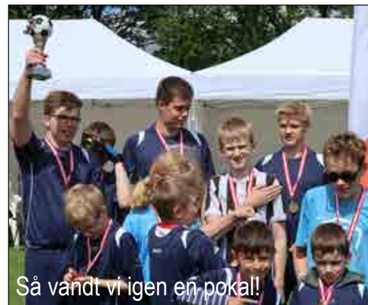
Så vandt vi igen en pokal!