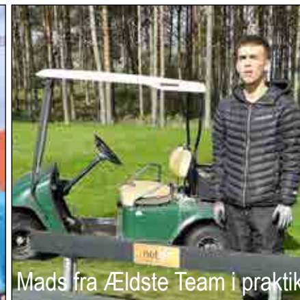
Mads fra Ældste Team i praktik