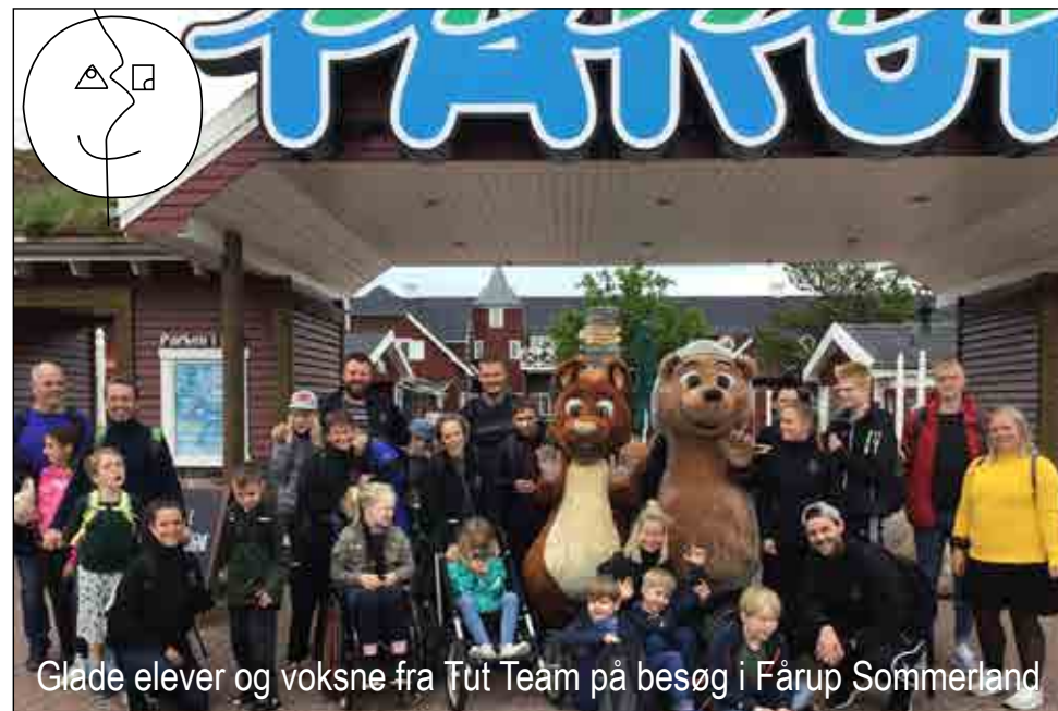
Glade elever og voksne fra Tut Team på besøg i Fårup Sommerland