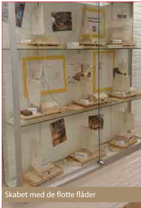
Skabet med de flotte flåder