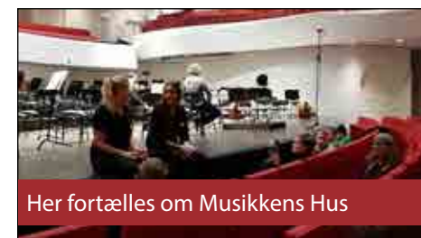
Her fortælles om Musikkens Hus