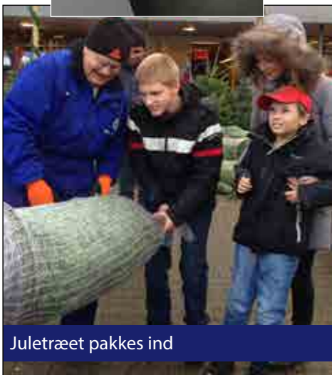
Juletræet pakkes ind