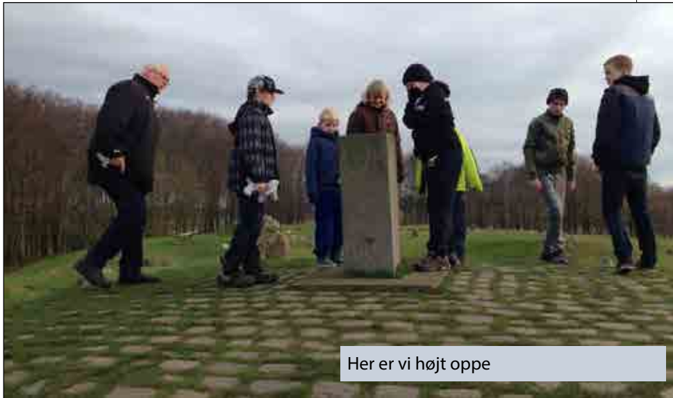
Her er vi højt oppe