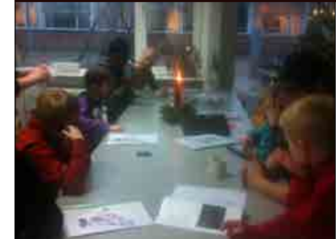
Det var en hyggelig eftermiddag

TUT sige mange tak for en rigtig hyggelig eftermiddag/aften!