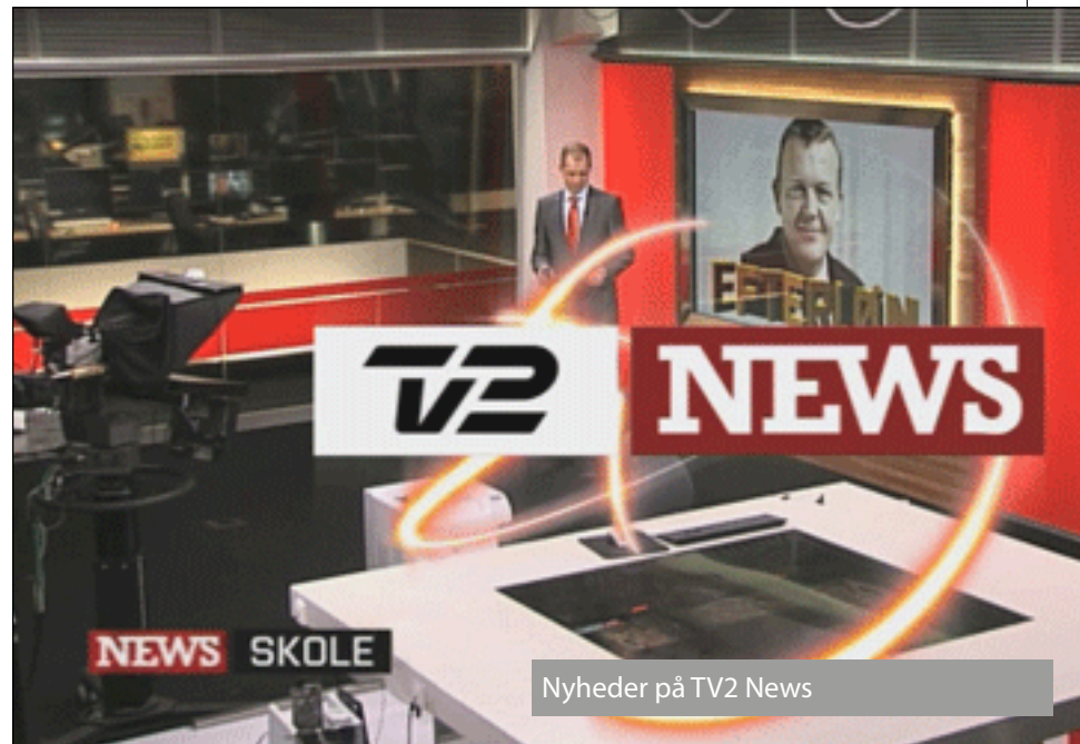
Nyheder på TV2 News

I lokale 1 er vi begyndt at benytte os af TV2 og deres tilbud til skoleelever. Der er lavet nyhedsudsendelser i "børnehøjde", som er letfordøjelige og med efterfølgende skoleopgaver til. Nyhederne er af en varighed på 5-8 min og strækker sig fra sportsnyheder til alt udenrigs.