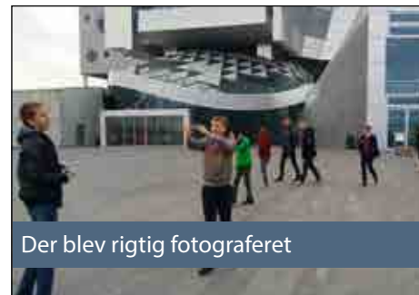
Der blev rigtig fotograferet

Eleverne fik bl.a. en opgave med at samle et stort puslespil, som bestod af en masse forskellige amøbeformer, som er brugt som dekoration flere steder i bygningen.