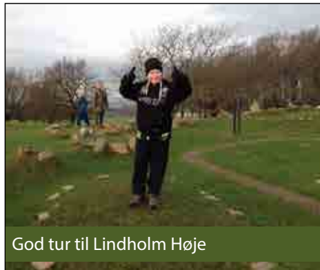
God tur til Lindholm Høje