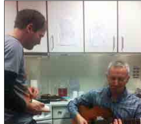
Der blev også spillet julesange