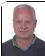
De varmeste julehilsner fra

Så med disse ord, vil jeg ønske jer en rigtig dejlig jul og et lykkebringende nytår. Mit ønske til det nye år, er at vi må fortsætte det gode og respektfyldte samarbejde og at det må gå alle godt!