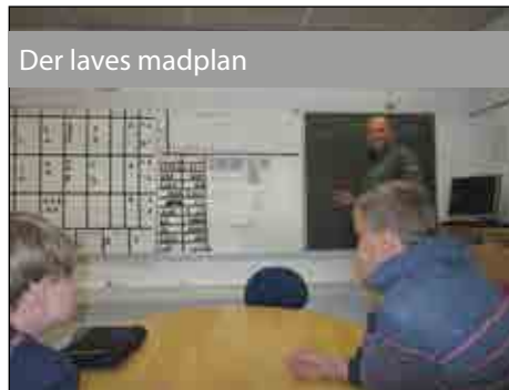
Der laves madplan

I forbindelse med det internationale projekt Comenius for elever med Autisme, havde Kollegievjens Skole inviteret til stegt flæsk med persillesovs for byrådsmedlemmer, pædagoger, ledere og elever.