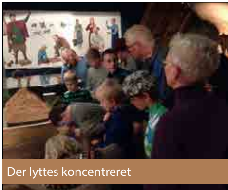
Der lyttes koncentreret