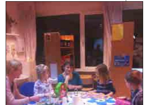
Der blev klippet og klistret