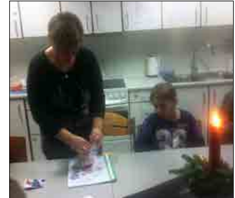
Der blev lavet flotte dekorationer

Torsdag d. 27. november var det traditionen tro tid til den årlige "Julehyggedag". Både elever og personale i TUT glæder sig til denne dag, hvor der er mulighed for at hygge med blandt andet juledekorationer, sang og hyggeligt samvær. Efter lidt tid med snak og hygge, skulle maverne fyldes med dejlig medbragt mad. Heldigvis kom julemanden også på besøg i år og bragte stor glæde for både små og store.