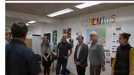
Der bydes velkommen