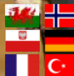
Uhm det smagte dejligt ...!