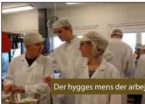
Der hygges mens der arbejdes!