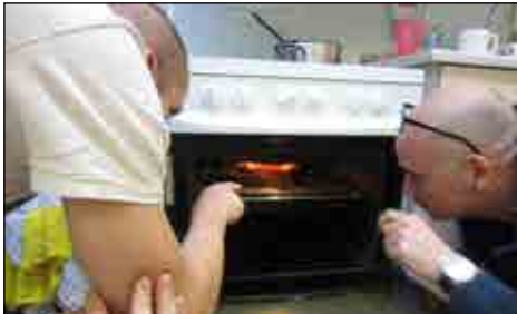
Flæsestegen tjekkes - ser go' ud!