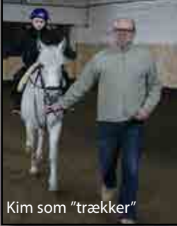
Kim som "trækker"