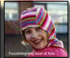
Forsidetegning lavet af Asta